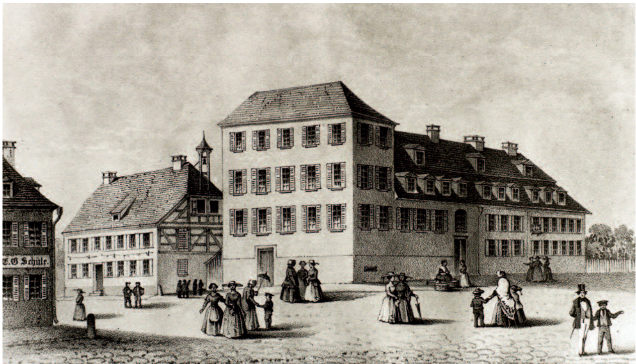
Das sogenannte «Töchterinstitut» in Korntal beherbergte ein Schülerinnenwohnheim, eine höhere Mädchenschule sowie eine Haushalts- und Frauenarbeitsschule. Wegen des schlechten Baugrunds aus Gipskeuper wurde es baufällig und musste in den 1950er-Jahren abgerissen werden. Heute steht an seiner Stelle das Korntaler Rathaus. Lithographie von A[dam] Gatternicht, Stuttgart, gezeichnet von O. Kolb, nach 1863.

Nach dem Zweiten Weltkrieg kamen viele Ungarndeutsche katholischen Glaubens nach Korntal. Jenseits der Bahnlinie außerhalb des Ortskerns wurde 1953/54 die katholische Kirche St. Johann errichtet, ein Jahr später die Christuskirche der württembergischen Landeskirche mit einem ungewöhnlich hohen Kirchturm, der ganz Korntal überragt. Ein Schelm, der Böses dabei denkt. Korntal ist heute nicht mehr die Brüdergemeinde, sondern die Brüdergemeinde ist in Korntal. Für sie wirksam geblieben ist das Anliegen ihres Gründers Gottlieb Wilhelm Hoffmann: Wir wachen, beten und bereiten uns, wie wenn der Herr morgen käme, und wir pflanzen und bauen, wie wenn es noch tausend Jahre so fortginge.