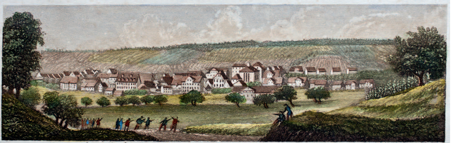
Korntal von der Südseite.

In der Ansicht der kleinen Gemeinde Korntal Mitte des 19. Jahrhunderts zeigt sich der besondere Charakter der Siedlung: Es ist kein bäuerliches Dorf, sondern ein Ort, der geprägt ist von den Einrichtungen der Brüdergemeinde. Randvignette aus dem Sammelbild «Korntal», gezeichnet von C(asper) Obach, gestochen von H. Bodmer, 1864.